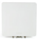
RADWIN 2000 Alpha EMB

La serie RADWIN 2000 Alpha está disponible en 5,8 GHz y 3,5 GHz. La serie Alpha en 5,8 GHz ofrece dos configuraciones de antena: