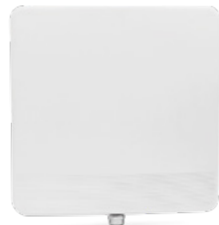
RADWIN 2000 Alpha INT