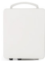
RADWIN 2000 D+ con conectores