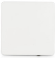
RADWIN 2000 D+ 23dBi

Los radios de la serie RADWIN 2000 D+ proporcionan 750 Mbps