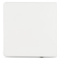
RADWIN 2000 A con antena de 23 dBi

La capacidad Ethernet se puede actualizar fácilmente a 100 Mbps por medio de una clave de software. Esto asegura una baja inversión inicial, mientras garantiza la capacidad de expansión futura. La serie RADWIN 2000 A está disponible con antena integrada de 17 dBi o 23 dBi, o en unidades con conectores.