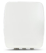
RADWIN 2000 A con antena de 17 dBi o conectores