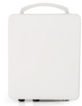
RADWIN 2000 C con conectores